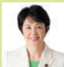
日本共産党 参議院議員 紙智子