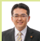
日本共産党 前衆議院議員 はたやま和也