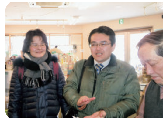
はたやま和也前衆院議員と振興会を訪問しました