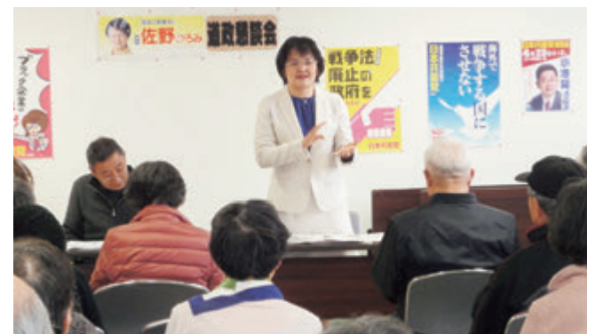
区民のみなさんへ議会報告