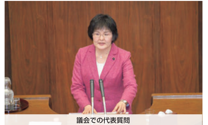
議会での代表質問