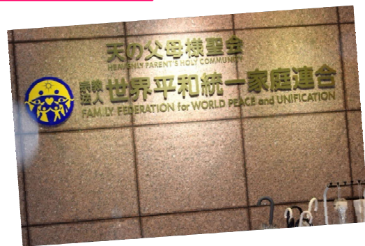
統一協会（世界平和統一家庭連合）本部 二東京都渋谷区（22年8月28日付「赤旗」）